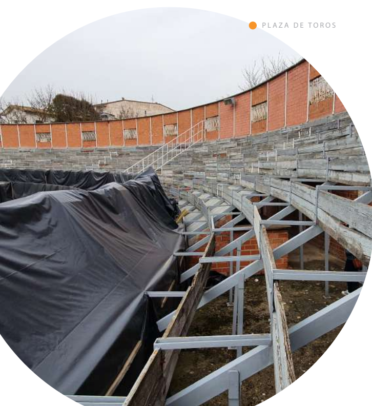
● PLAZA DE TOROS

El resto, unos 55.700 €, se destinarían a proyectos variados, que desconocemos y para los que, al parecer, APS-Bildu no quiere votación popular como en 2020... ¿Por qué será?