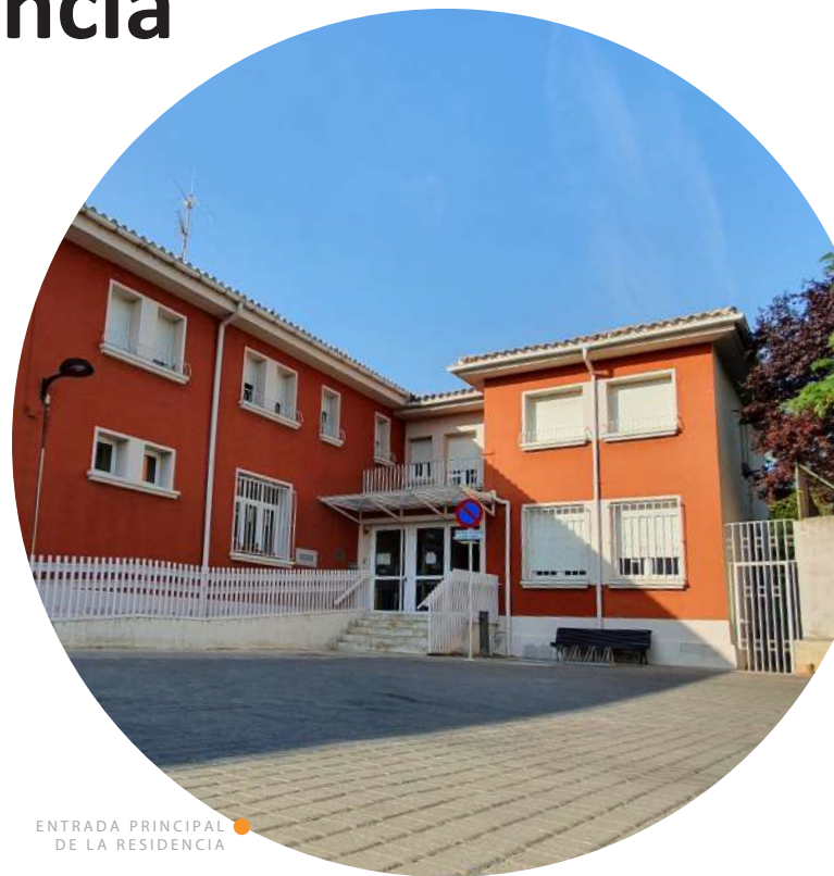
ENTRADA PRINCIPAL DE LA RESIDENCIA

Además, advirtió sobre no haber realizado simulacros de evacuación desde 2017 ni mantenimiento de las barandillas de cama y no haber consensuado con los residentes cada Plan de Cuidados Individualizado . Advertencias que pueden derivar en sanciones de entre 12.000 y 60.000 € cada una.